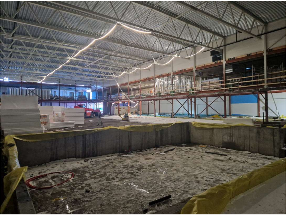
Bilder fra byggeprosjektet pr 23.02.2024.