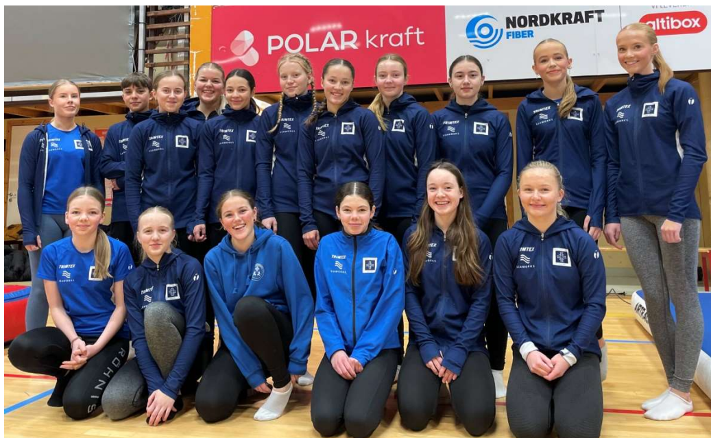
En del av våre Unge trenere

HTF har siden 2018 hatt et eget Unge trenere-prosjekt, der vi forsøker å rekruttere unge gymnaster eller unge tidligere gymnaster som trenere i HTF, og å gi dem mulighet til å ta kurs og utdanning som del av prosjektet. I tillegg lønnes de med kr 5.000 pr halvår der de forplikter seg til 1-2 treninger pr uke. Det er en forutsetning av deres egne turntreninger og nødvendig skolearbeid går foran treneroppgavene. Unge trenere-kontraktene er forbeholdt trenere som ikke er i fullt arbeid, men som er skoleelev/student. Vi hadde i 2023 ca 20 unge trenere i prosjektet. I 2022 fikk vi støtte fra Equinor og fra Samfunnsløftet som i 2023-2024 har vært nyttet til å dekke kurskostnader for de unge trenerne. For 2025 har ca 25 unge trenere. Vi har støtte fra Hurtigruten Group og Gjensidigestiftelsen. Fra 2025 legger vi om til et timebasert lønssystem, samtidig som vi øker jobbmulighetene med mange nye partier og Åpen turnhall.